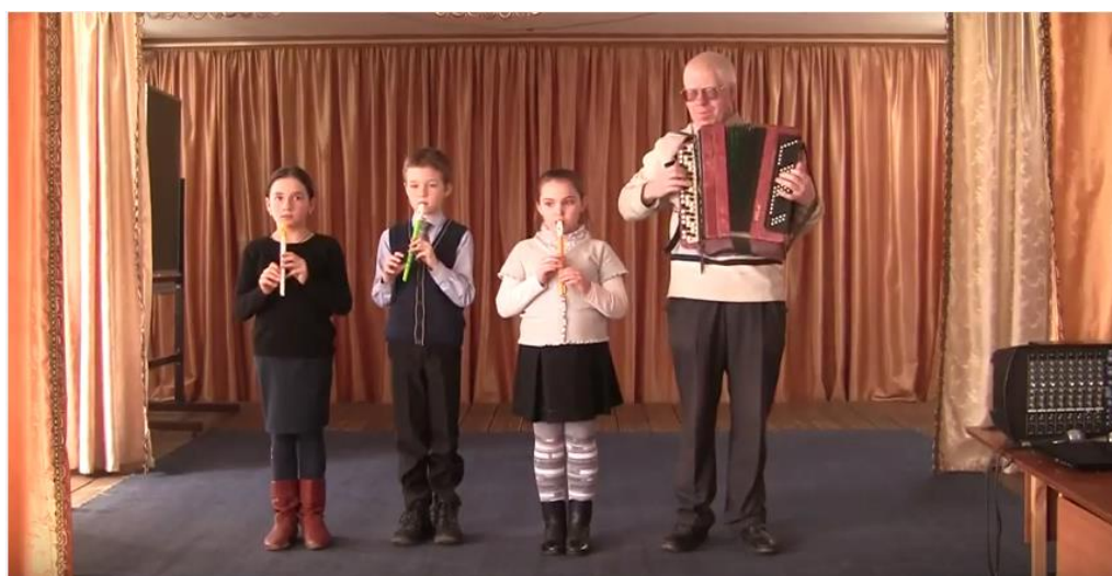
Трио начальных классов ОКОУ «Пенская школа-интернат для детей с ограниченными возможностями здоровья», занимающиеся на базе МКУДО «Центр детского творчества» пос. Карла Либкнехта Курчатовского района Курской области, руководитель: