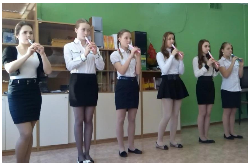
Ансамбль 8 класса