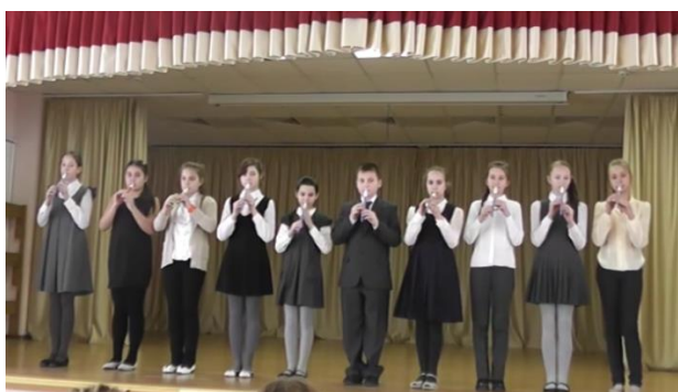
Ансамбль 5 «А» класса