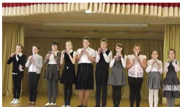
Ансамбль 5 «Б» класса