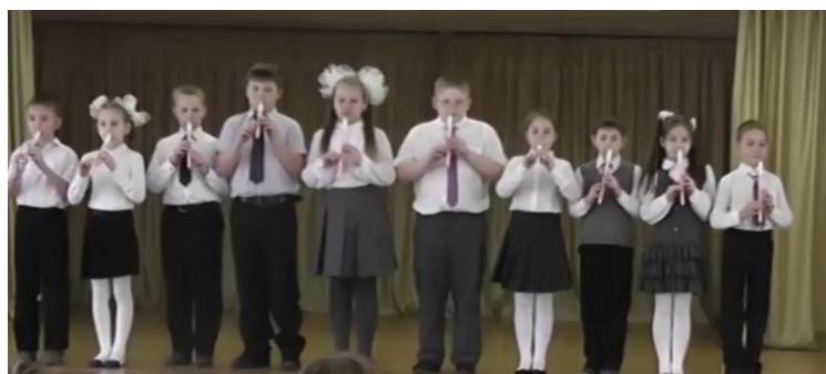
Ансамбль 2 «А» класса