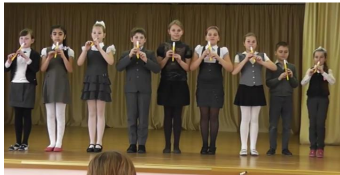
Ансамбль 3 «Б» класса