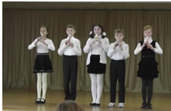
Ансамбль 4 «Б» класса