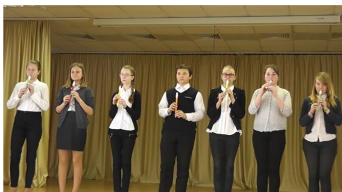
Ансамбль 7 «В» класса