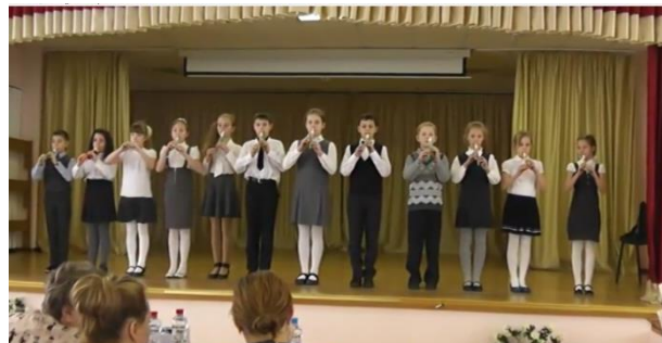
Ансамбль 3 «В» класса