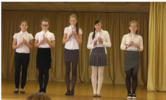
Ансамбль 6 «А» класса