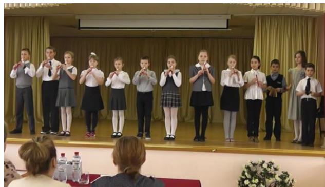
Ансамбль 3 «А» класса