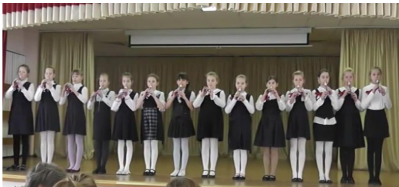
Ансамбль 4 «В» класса