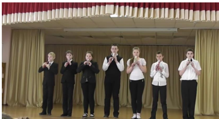
Ансамбль 6 «Б» класса