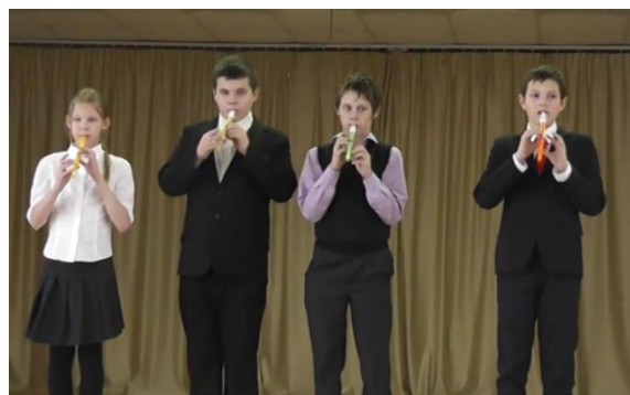
Ансамбль 5 «Г» класса