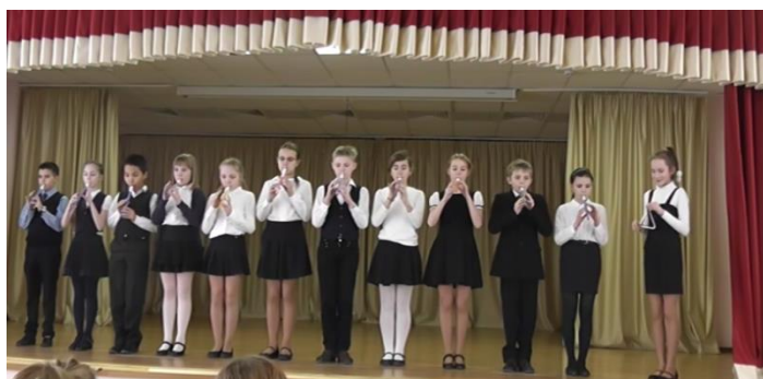
Ансамбль 5 «В» класса