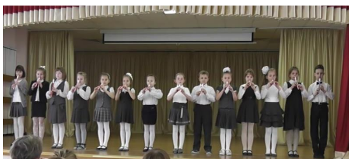
Ансамбль 2 «В» класса