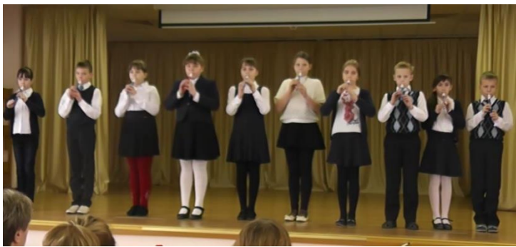
Ансамбль 4 «А» класса